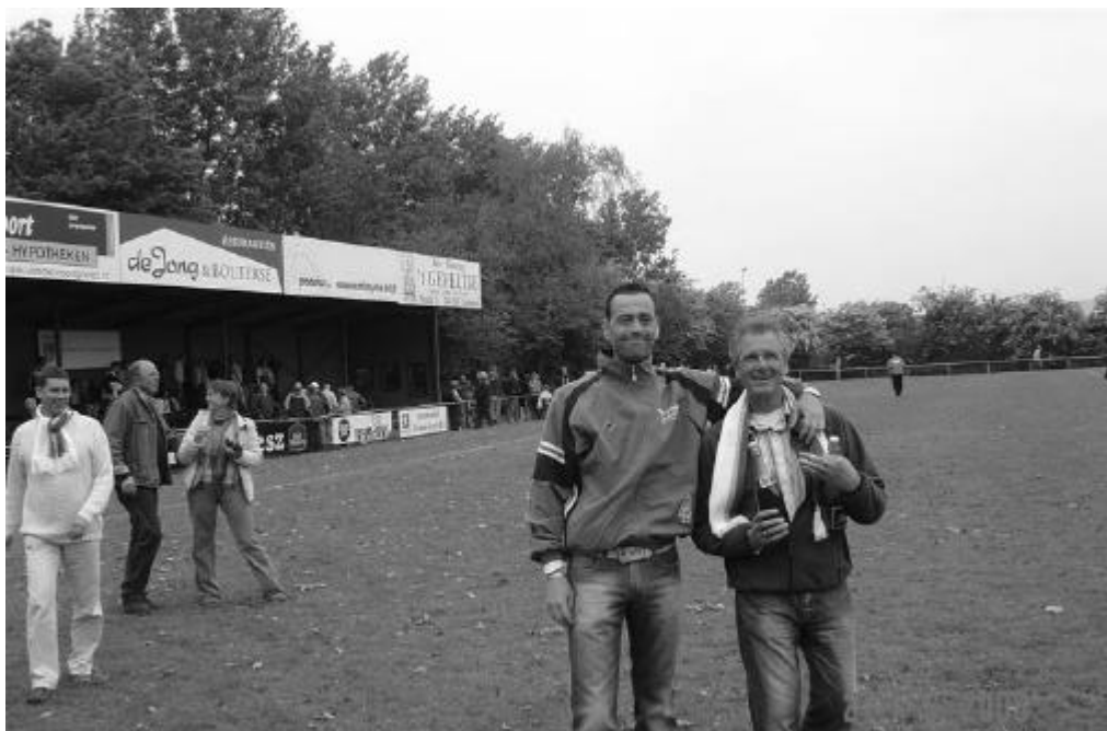
Champagne in aantocht...