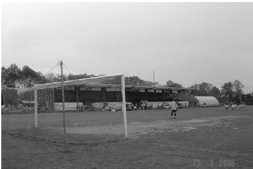
De 1e helft was duidelijk eentje met een hoog gehalte 'middenveldvoetbal'. De 2e helft zou hier het verschil maken. KFC - BOL (1-5) dd. 13 mei 2006