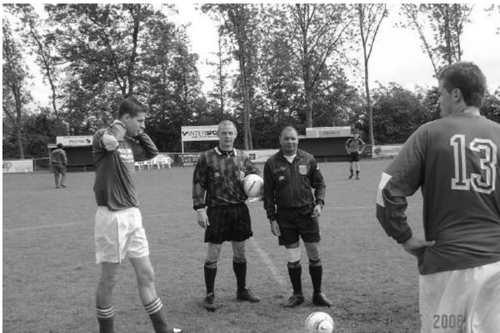
Klaar voor de start, BOL - DEK (0-0) dd. 20 mei 2006