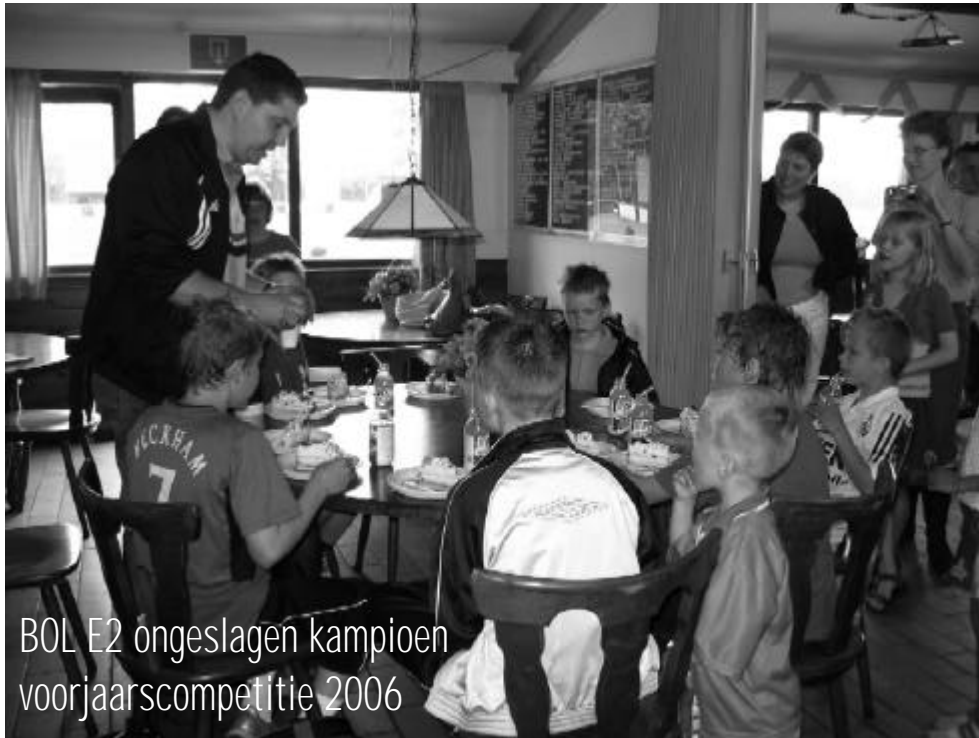
BOL E2 ongeslagen kampioen voorjaarscompetitie 2006