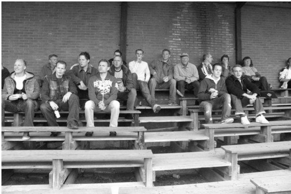
...met wederom heel wat BOL publiek. SVAP'74 - BOL, dd. 27 mei 2006.