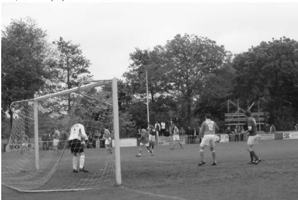
SVAP'74 - BOL (1-2), dd. 27 mei 2006