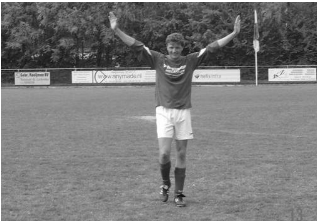
Broertjes blij, iedereen blij, KFC - BOL (1-5) dd. 13 mei 2006