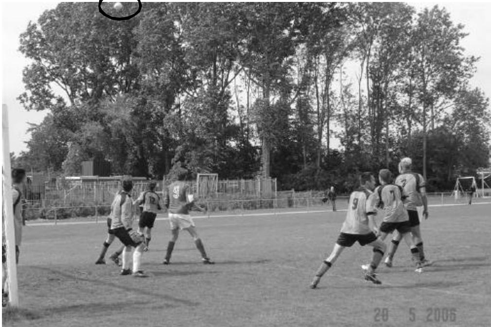
...nul, BOL - DEK (0-0) dd. 20 mei 2006