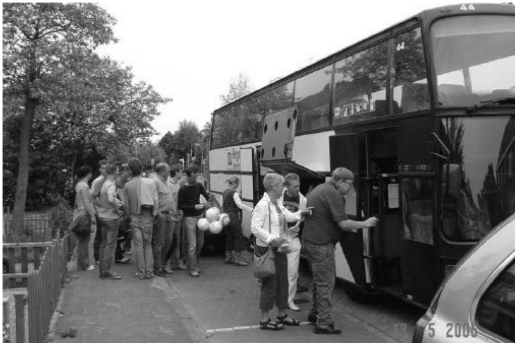
Bus met spelers en publiek naar KFC - BOL (1-5) dd. 13 mei 2006