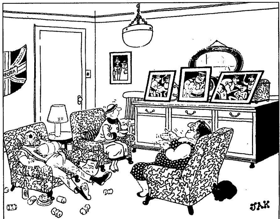
„Ach, Sie kennen Willis Ferien-Schnappschüsse noch nicht?“

Großbritanniens Rowdys schlagen nicht mehr nur in Fußballstadien und Großstädten zu. Eine „alarmierend anschwellende Flut von Gewalt“ („Financial Times“) schwappt in bislang ruhige ländliche Gegenden, in denen „immer