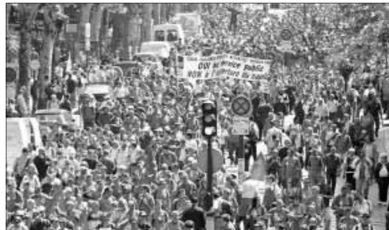
Zaposlenici u Francuskoj nacionalnoj električnoj i plinskoj kompaniji (EDF/GDF) prosvjeduju na ulicama Pariza zbog reorganizacije i djelomične privatizacije

Skandal je bio strašan, naročito je pogadala spoznaja da je društvo zanemarilo svoje najstarije